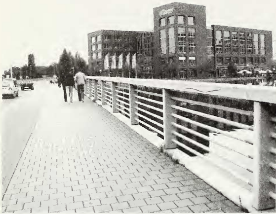
Abb. 1: Der Studienort im Duisburger Innenhafen. Zu erkennen sind die sich wiederholenden, gleichförmigen Abschnitte des Dammgeländers, an denen nachts und in der Dämmerung L. sclopetarius aktiv wird. In den Handläufen befinden sich Lampen.